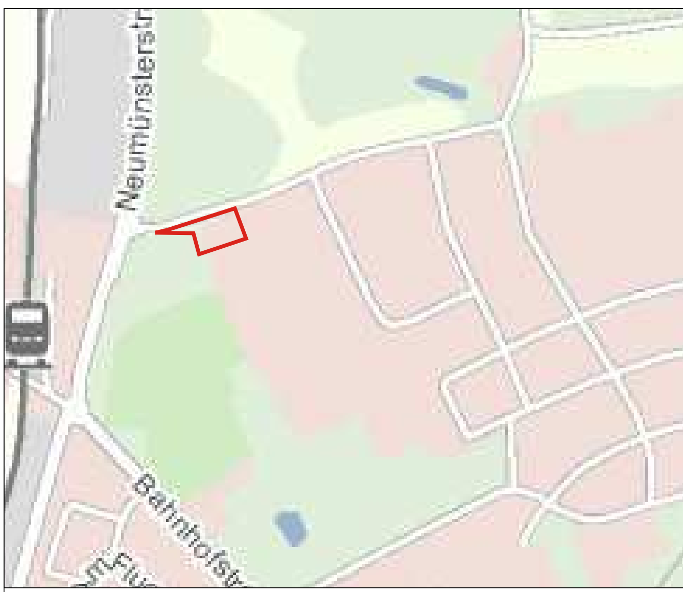
Übersichtskarte (ohne Maßstab)